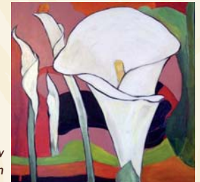
Maleri av Nenna Steinset Halvorsen