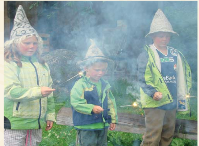
Fra jakten på "Tusseskatten".