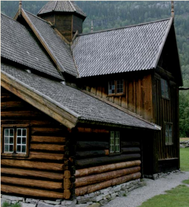
Nore stavkirke.

En natur- og kulturhistorisk perle sentralt på Østlandet