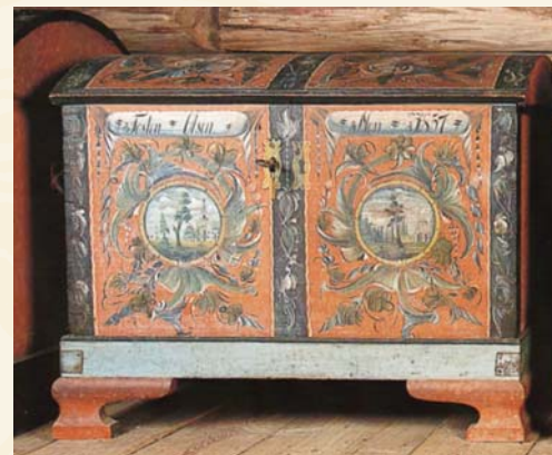
Kiste malt av Sebjørn Kverndalen.

På middelaldergården blir det kveldsstemming når vi setter oss for å høre legenden om "Kong Arthur og hva alle kvinner ønsker seg mest" ved historieforteller Espen Holm. Liv Bergset spiller sjøfløyte. Inngang kr. 150,- (barn gratis)