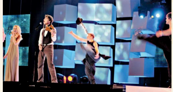
Alexander Rybak og dansegruppa Frikar.